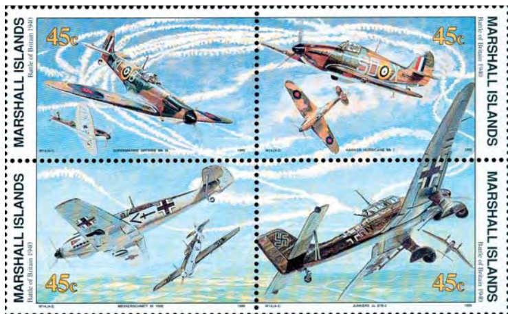
På detta fyrblock från Marshallöarna är de bägge brittiska jaktflygplanen Supermarine Spitfire Mk 1A (längst upp t.v.) och Hurricane Mk 1 (längst upp t.h.) avbildade. Längst ner t.v. ser vi det tyska jaktflygplanet Messerschmitt Bf 109E medan en tysk Junkers Ju 87B-2, även kallad störtbombare, är avbildad på frimärket längst ner t.h.

hann begå självmord innan domen verkställdes.