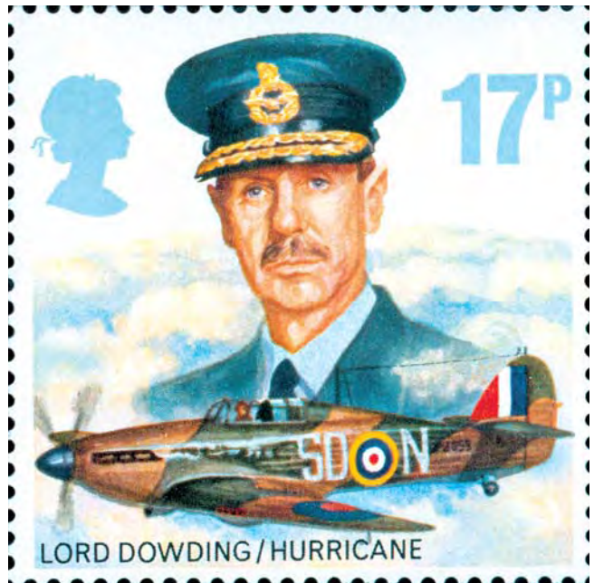
Det var flygmarskalk sir Hugh Dowding som var hjärnan bakom det brittiska jaktkommandots strategi under slaget om Storbritannien. Här är Dowding avbildad på ett frimärke utgivet av Storbritannien.

Hermann Göring som lagt sig till med en överdådig stil, han klädde sig alltid praktfullt och bodde i ett slott, ägnade också mycket tid till att fin-kamma de ockuperade ländernas museer efter konstskatter