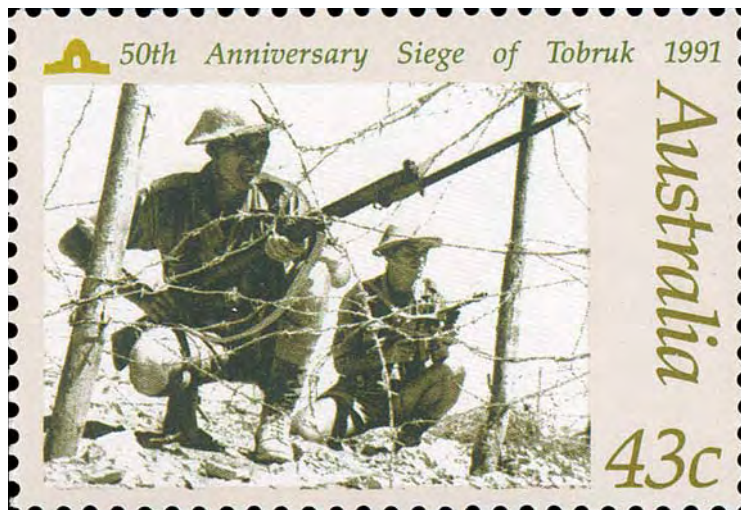
Detta australiensiska frimärke utgavs 1991 till 50-årsjubileet av den misslyckade tyska belägringen av Tobruk. Frimärket visar brittiska (australieniska) soldater på rekognosceringsuppdrag vid de starkt befästa linjerna runt Tobruk.