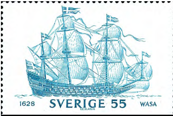
Regalskeppet Wasa som kantrade och sjönk i Stockholms ström 1628 var byggt under Gustav II Adolfs regeringstid. Wasaskeppet var tänkt att bli ett viktigt tillskott för den svenska krigsmakten, som utvecklades starkt under Gustav II Adolfs ledning. Frimärket som ingick i ett häfte gavs ut 1969, och är graverat av Czeslaw Slania. Tryckmetoden är stålgravtryck.

och baktanken var att än mer stärka adelns makt i samhället. Alla tjänster inom ämbetsverken var nämligen förbehållna adelsmännen.