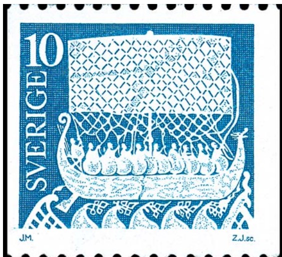
Motivet på detta frimärke, utgivet 1973, är hämtat från den märkliga bildsten som under 700-talet restes på norra Gotland, i Lärbo socken. Bilden kan mycket väl föreställa de stupade krigarnas sista färd till Valhall.