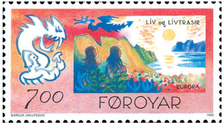
Liv och Livtrasir, människoparet som mirakulöst överlevde Ragnarök, ser solen gå upp över den nya jorden på detta frimärke från Färöarna, utgivet 1995. Även draken Nidhögg skymtar förbi. I frimärkets vänstra hörn slåss den starke åsk- och vindguden Tor med Midgårdsormen.

Kvinnan fick genomgå en lång rad ritualer. Slutligen hade hövdingens närmaste män rituellt könsungänge med slavinnan varefter en äldre kvinna, av Ibn Fadlan kallad "dödens ängel", trädde in. Hon