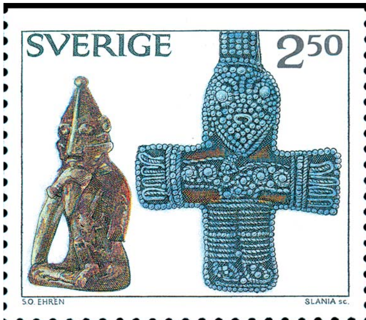
Detta frimärke, utgivet 1990, kan sägas symbolisera brytningen mellan hedendom och kristendom. Till vänster på frimärket är en gudafigur – troligen föreställande fruktbarhetsguden Frej – avbildad. I högra delen på frimärket syns ett kristet krucifix.

En bättre källa är i så fall de gotländska bildstenarna. På flera av dem kan man nämligen finna motiv som återkommer i de skriftliga källorna, motiv som återger religiösa ritualer, men även kopplingar till själva mytologin går här att göra. Odens häst, den åtta-benta Sleipner, finns avbildad på ett flertal av de gotländska bildstenarna.